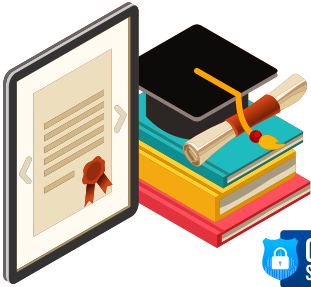
निःशुल्क साइबर सुरक्षा सर्टिफिकेट कोर्स/बुकलेट