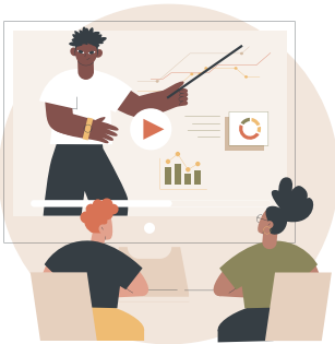
कॉलकम द्वारा आयोजित प्रतियोगिताओं/कार्यशालाएं में बिना किसी शुल्क के प्रवेश