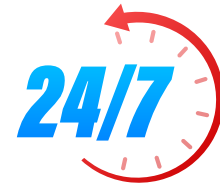
साइबर सुरक्षा सहायता

आज ही मेंबरशिप ले और समाज में अपना योगदान दें।