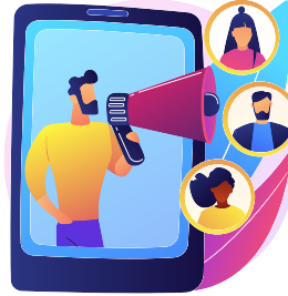
कॉलेज/शहर/राज्य स्तर पर साइबर एम्बेसडर बनने का मौका