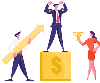
मेंबरशिप के दौरान अच्छा कार्य करने पर अवार्ड, सर्टिफिकेट और आकर्षक इनाम