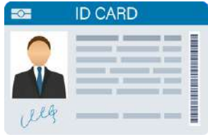
संगठन सदस्यता ID कार्ड